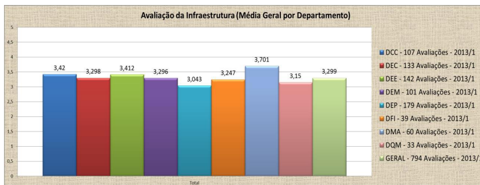
Gráfico 1 – Comparativo da Infraestrutura dos departamentos do CCT.

J. quanto à Chefia de Departamento/Coordenação do Curso